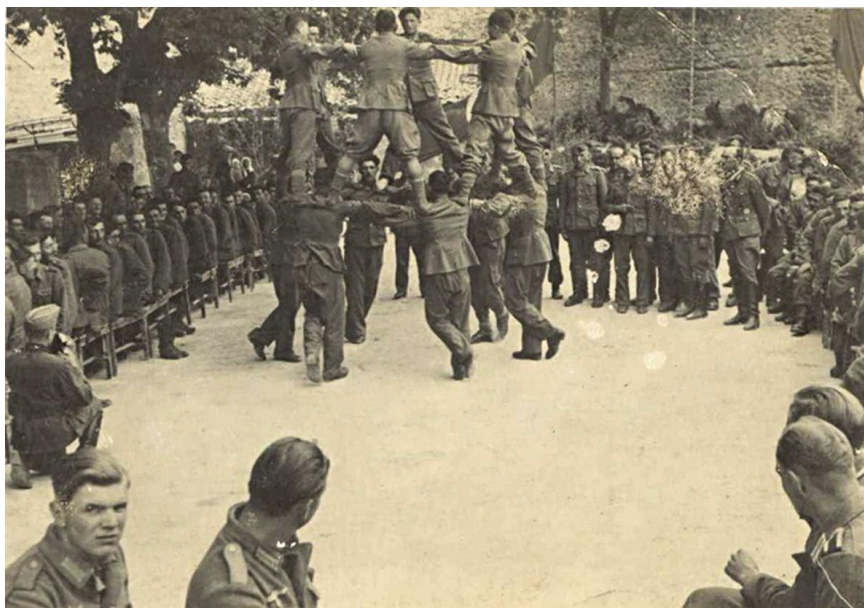
Победный танец Кочари у стен Рейхстага

После войны дивизия вернулась в Армению, а в 1956 году в связи с расформированием национальных дивизий ВС СССР была также расформирована.