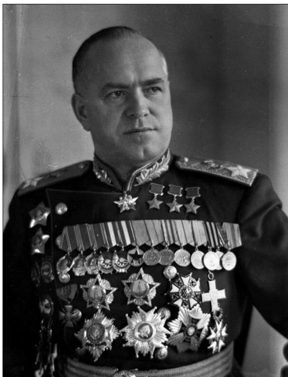
Маршал победы Жуков Георгий Константинович